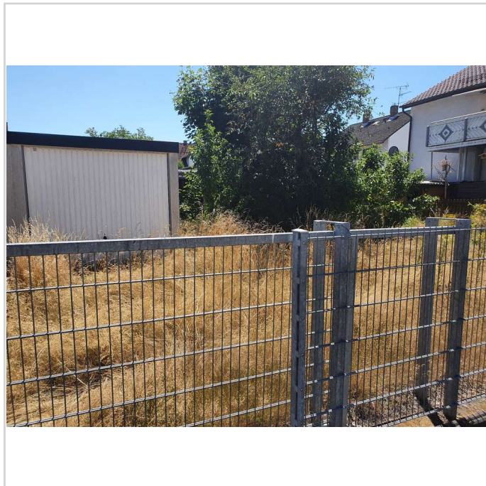
Rollwald Bild 1

Der Wohngebiet in dem Bebauungsplan Rollwald I unterliegt einer Veränderungssperre. Die Änderung des Bebauungsplans wird erwartet ca. zum Oktober 2023.