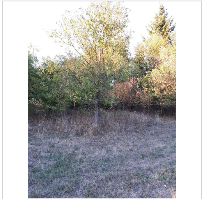
Schweinheim, Bild 2